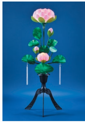
蓮華(ピンク回転式)